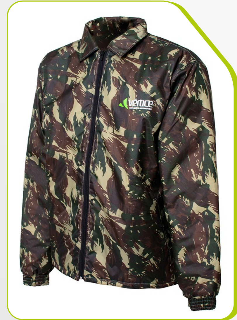
JAPONA CAMUFLADA COM GOLA