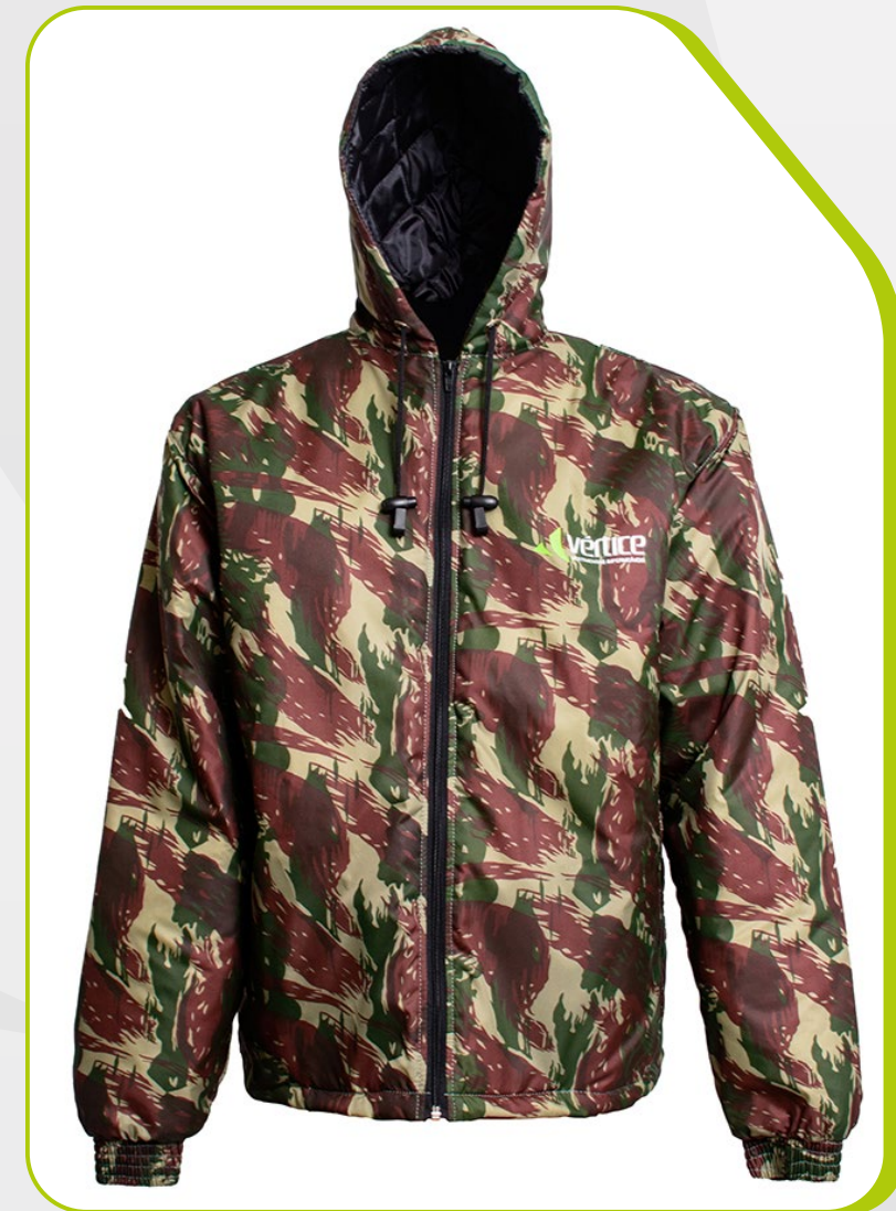
JAPONA CAMUFLADA COM CAPUZ