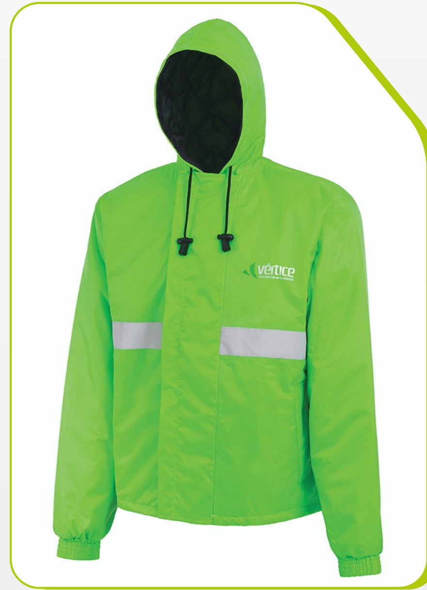
JAPONA OPERACIONAL COM CAPUZ