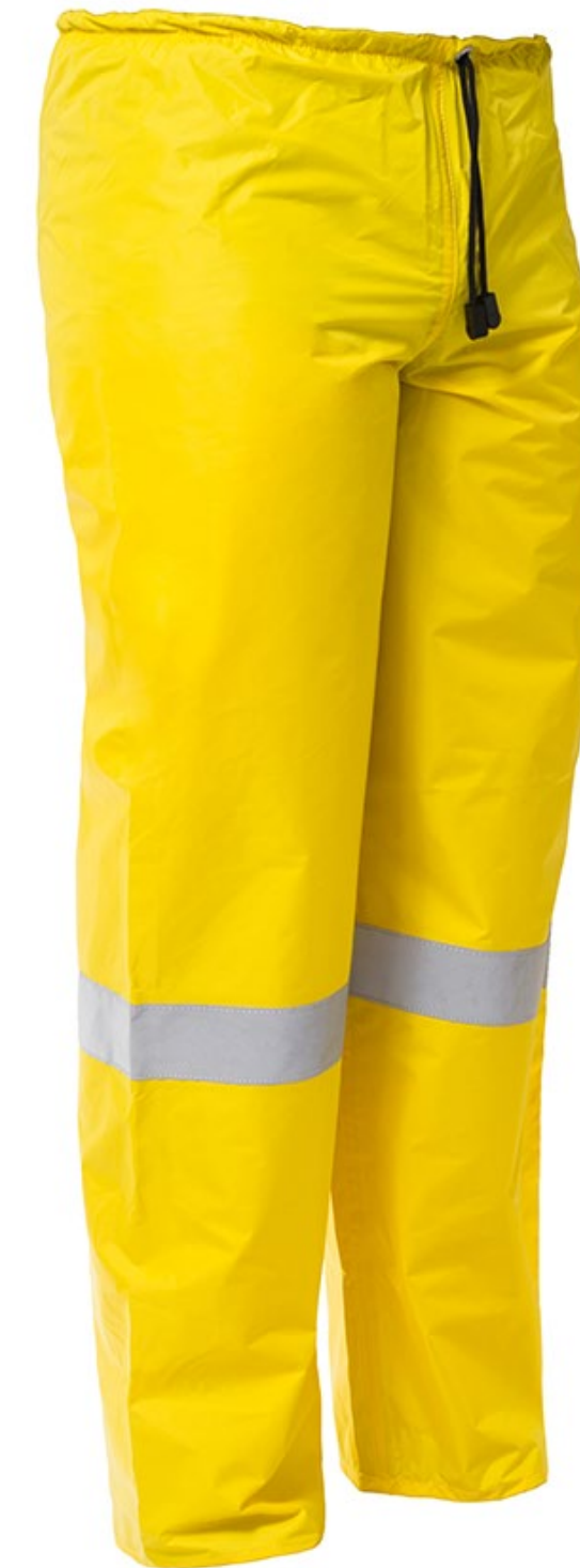
CALÇA PADRÃO IMPERMEÁVEL