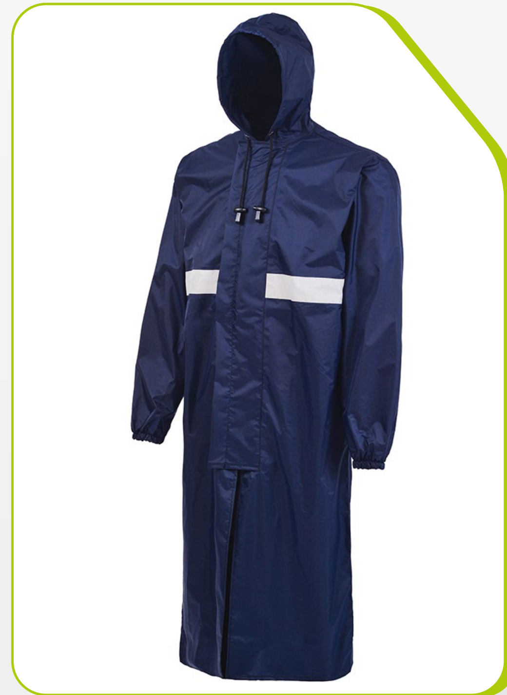
CAPA PADRÃO IMPERMEÁVEL