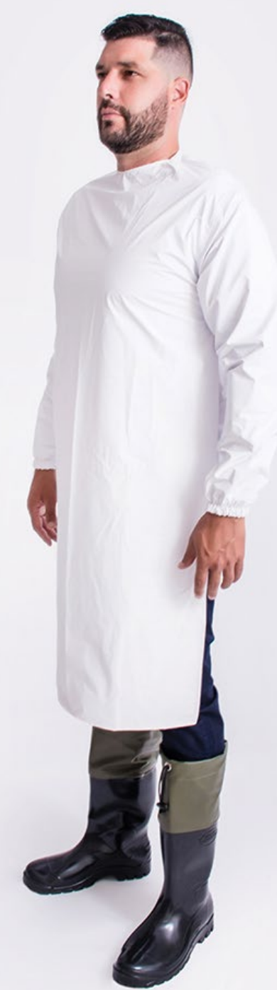
AVENTAL COM MANGAS IMPERMEÁVEL