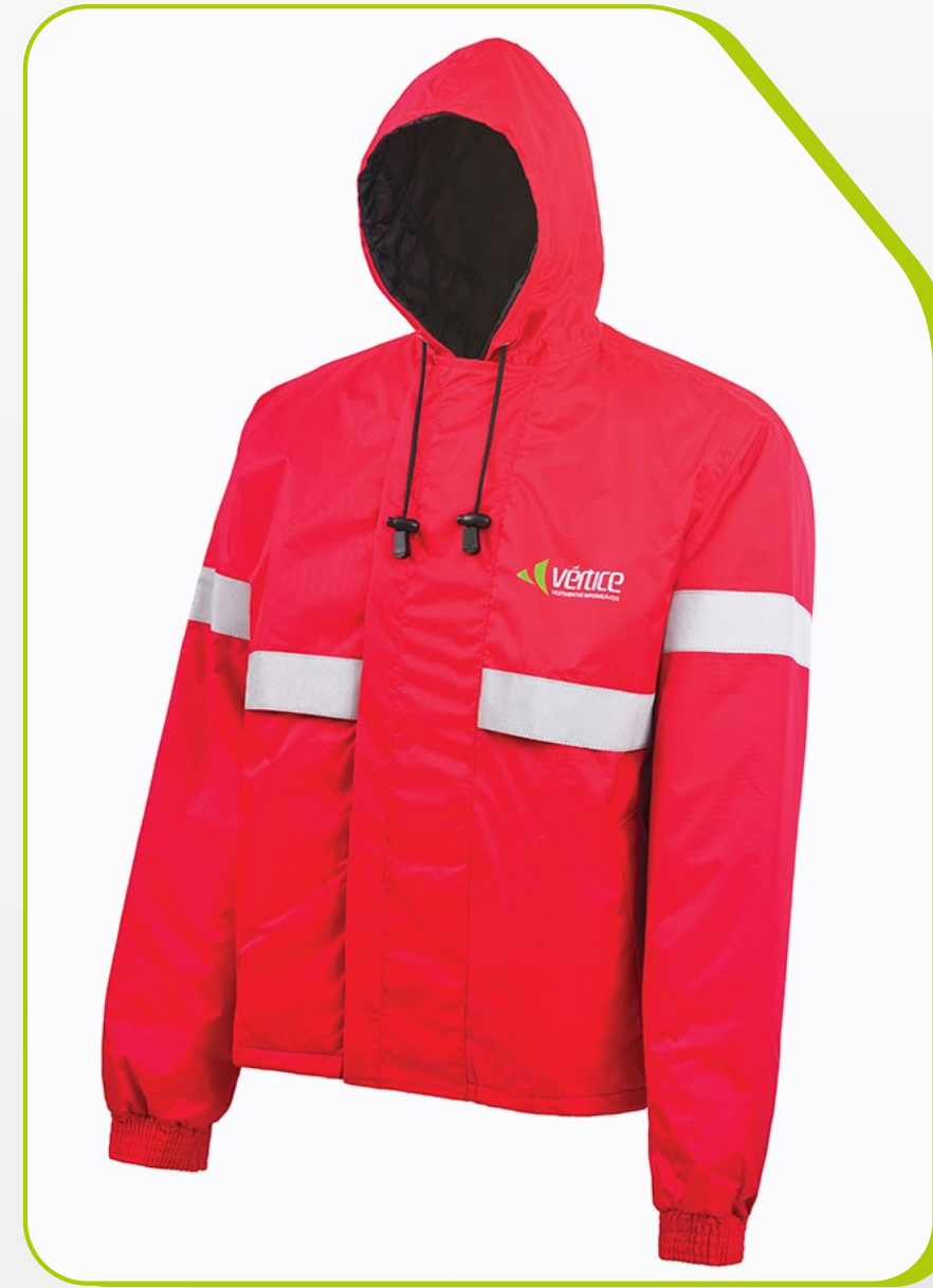
JAPONA VENTILADA OPERACIONAL IMPERMEÁVEL