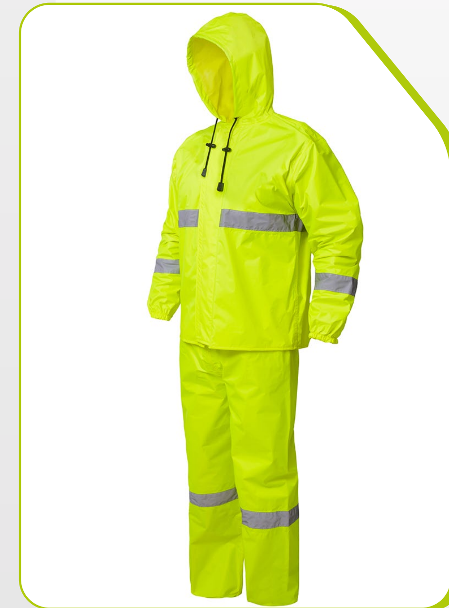
CONJUNTO PADRÃO COM FAIXAS IMPERMEÁVEL

Ref.: 3020R C.A. 28.742 Jaqueta C.A. 28.740 Calça