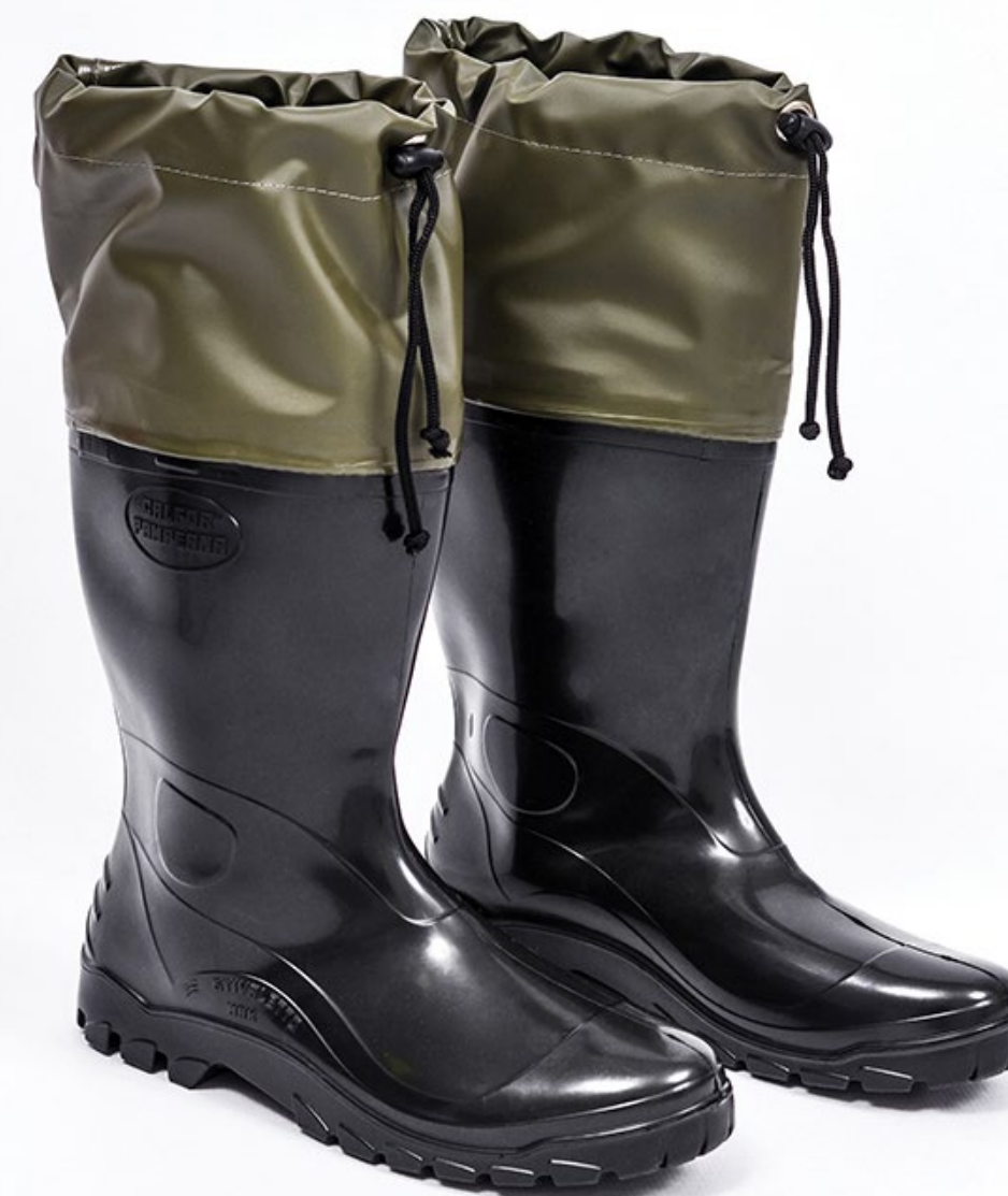
BOTAS DE PVC COM POLAINA