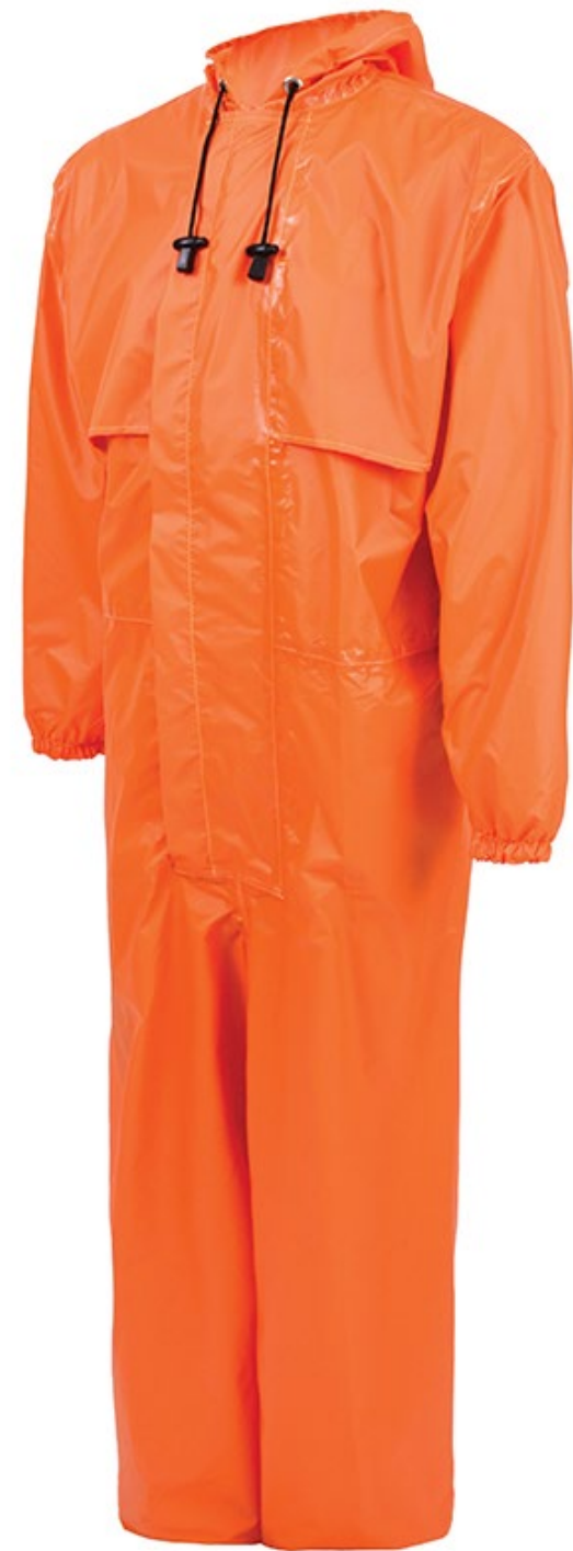
MACACÃO VENTILADO IMPERMEÁVEL