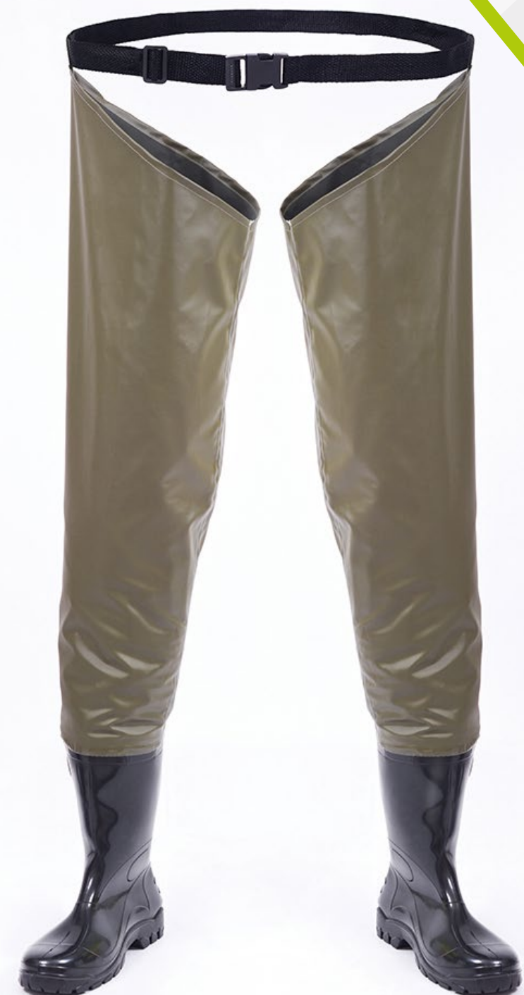
PERNEIRA IMPERMEÁVEL COM BOTAL