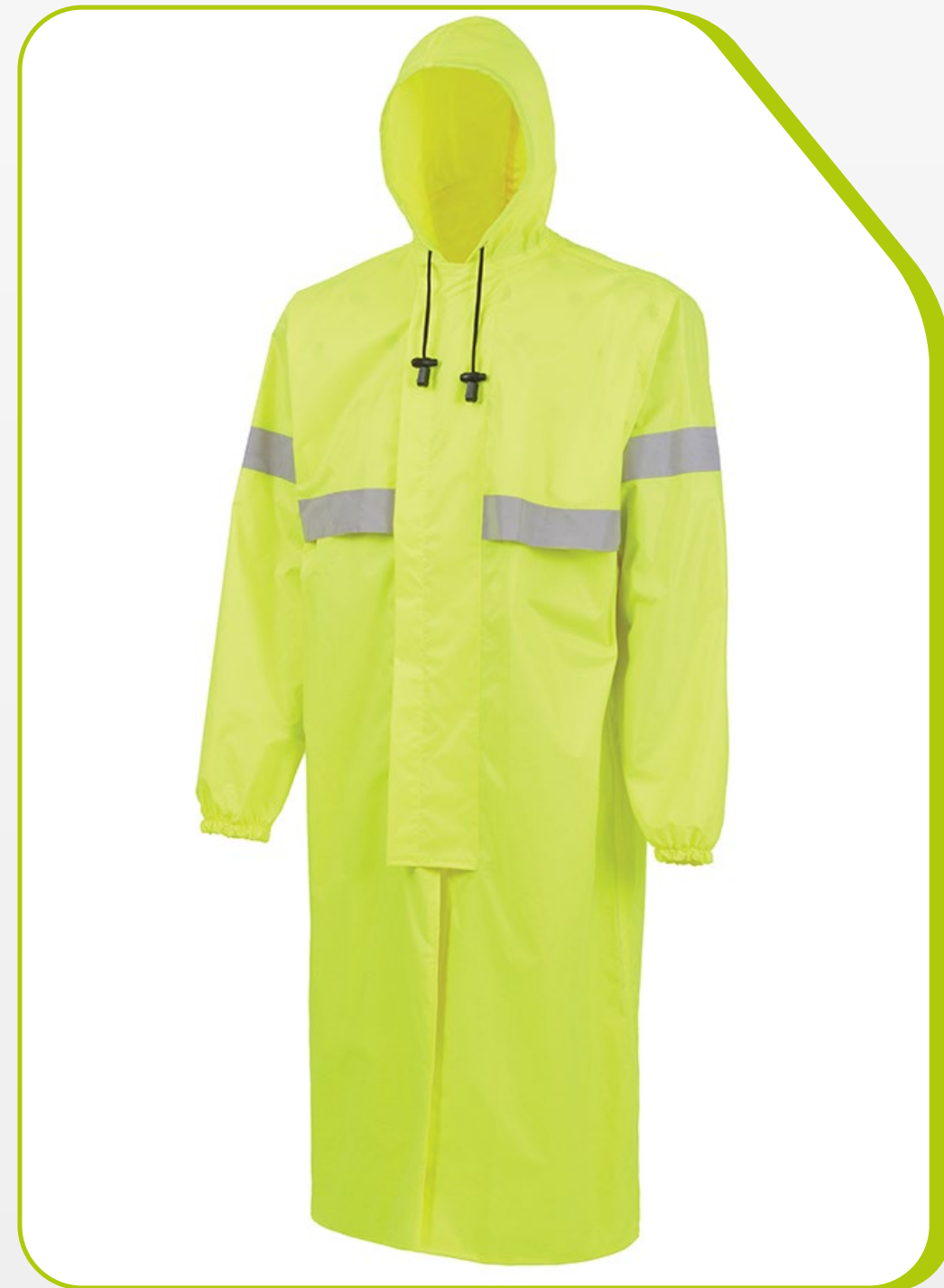
CAPA VENTILADA IMPERMEÁVEL