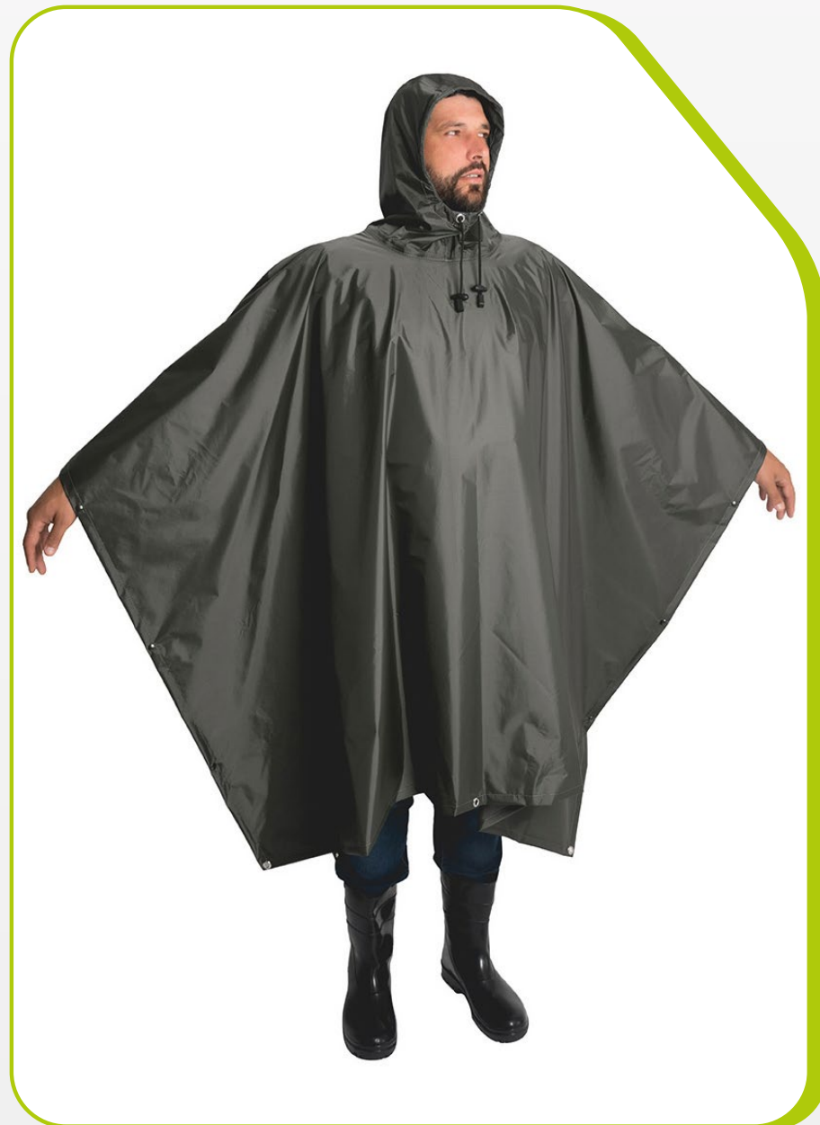
CAPA TIPO "PONCHO" IMPERMEÁVEL