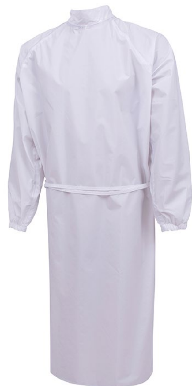
AVENTAL TIPO CIRÚRGICO IMPERMEÁVEL