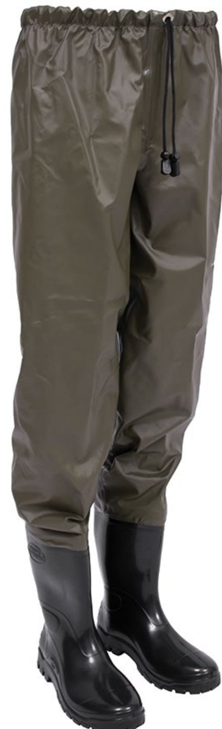
CALÇA IMPERMEÁVEL COM BOTAS

C.A. 28.726 (Jardineira com Botas de PVC com palmilha e biqueira de aço)