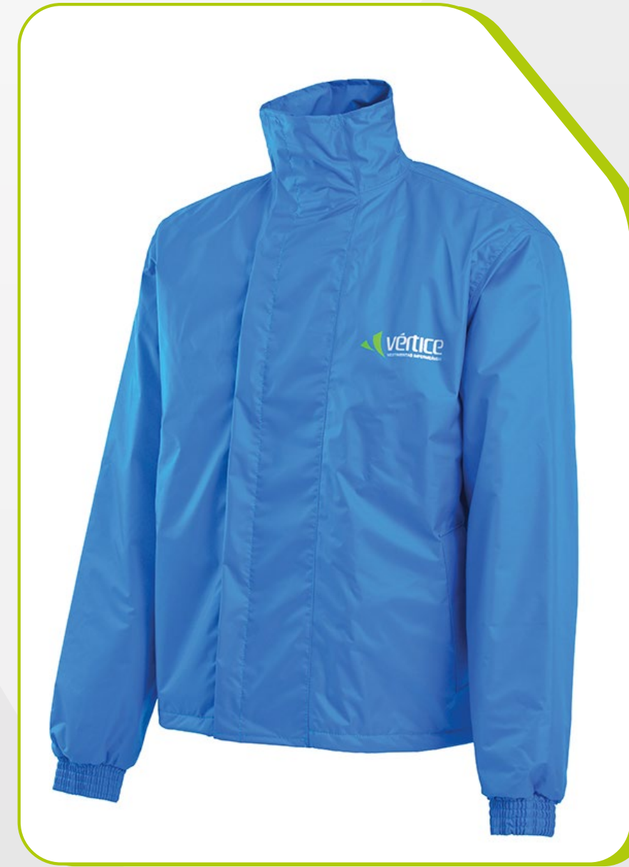
JAPONA OPERACIONAL COM GOLA