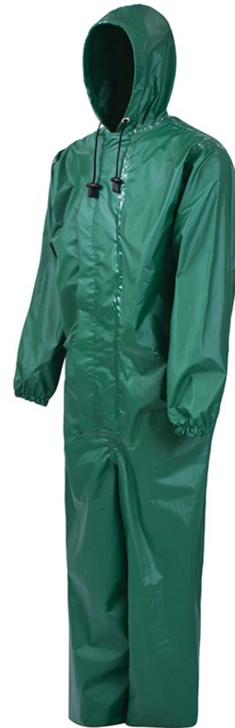
MACACÃO PADRÃO IMPERMEÁVEL