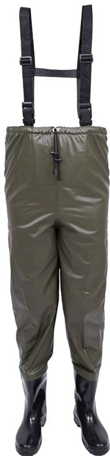
JARDINEIRA IMPERMEÁVEL COM BOTAS