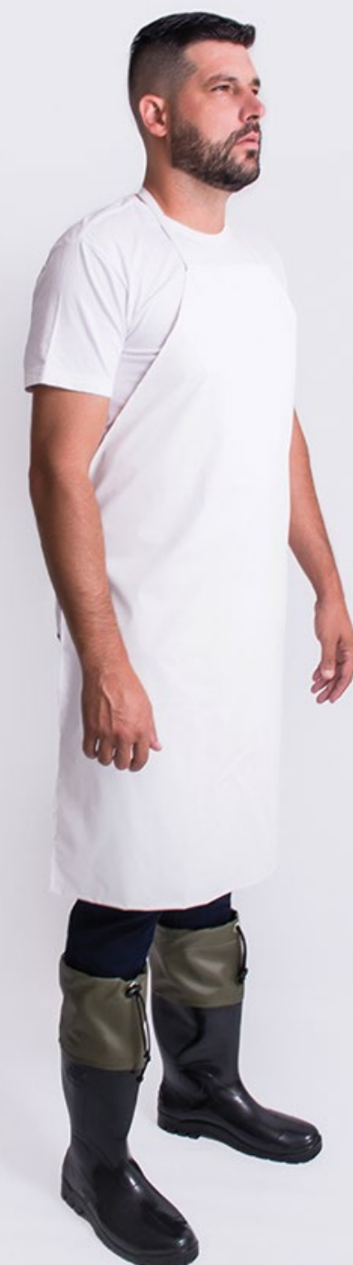
AVENTAL PADRÃO IMPERMEÁVEL