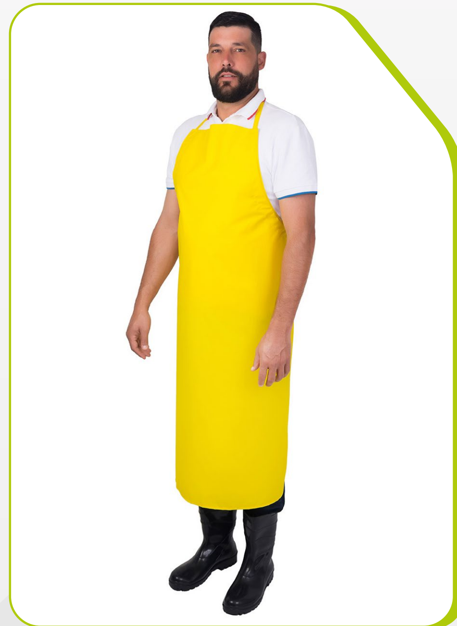
AVENTAL IMPERMEÁVEL QUÍMICO