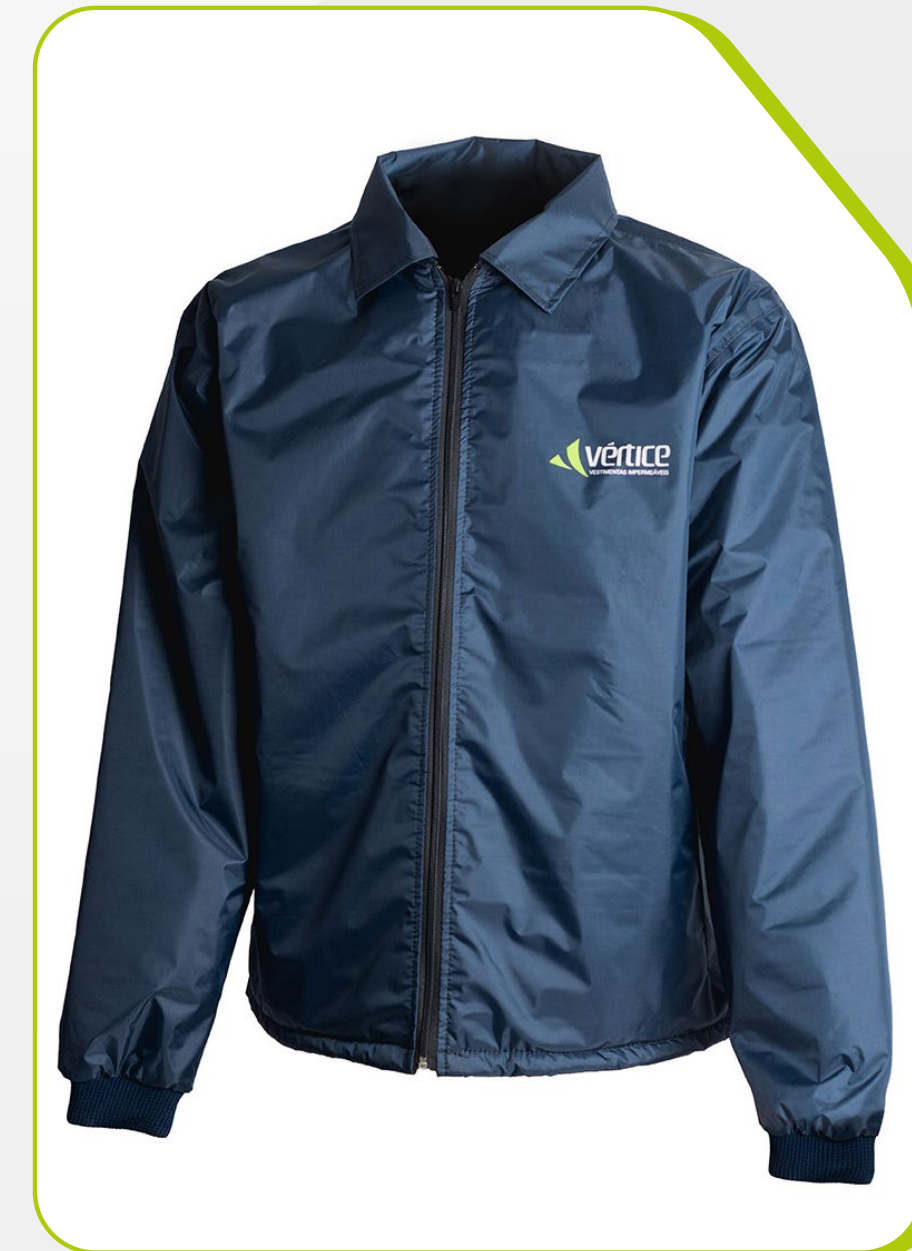
JAPONA ADMINISTRATIVA IMPERMEÁVEL