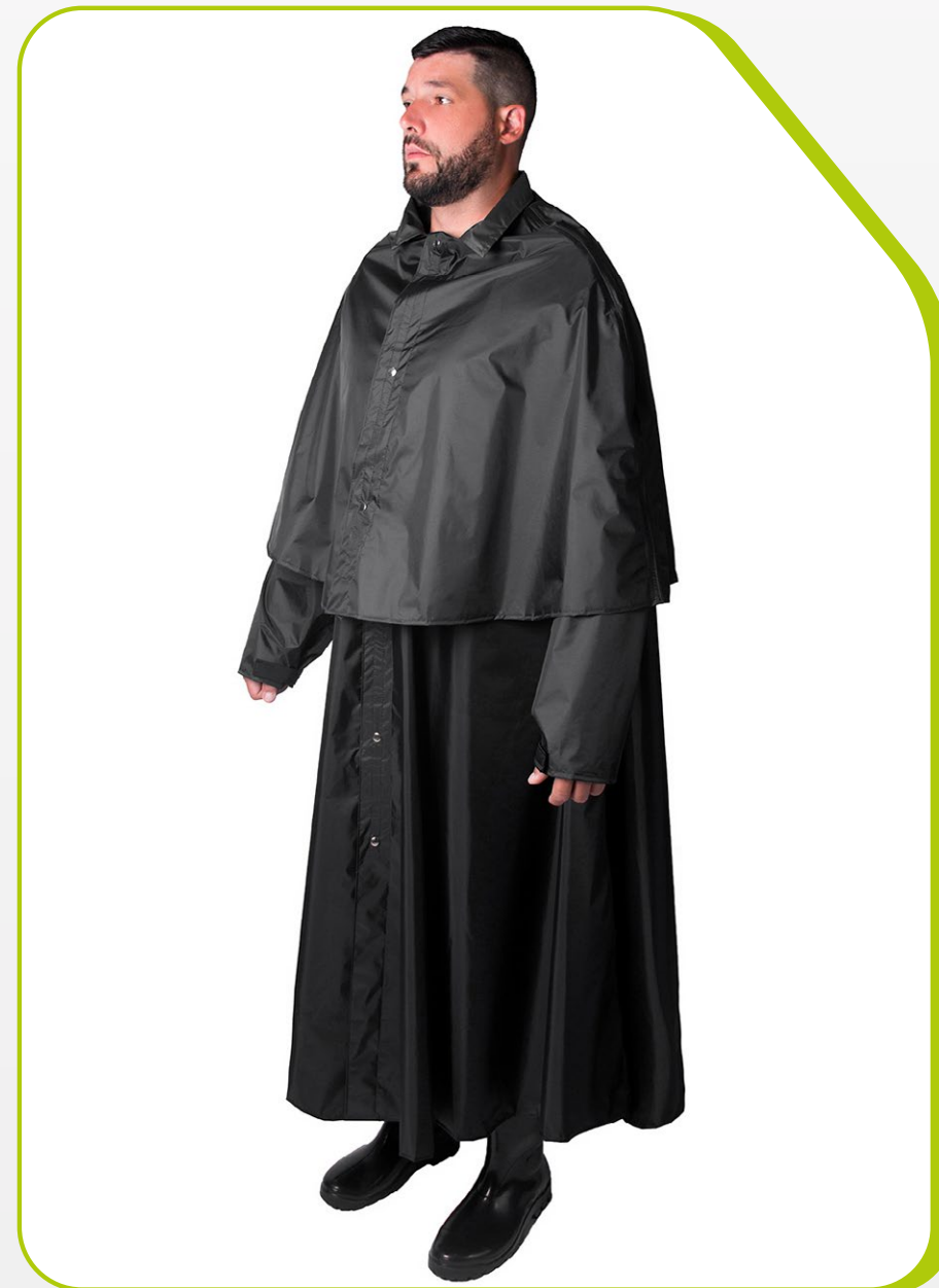
CAPA TIPO "MONTARIA" IMPERMEÁVEL