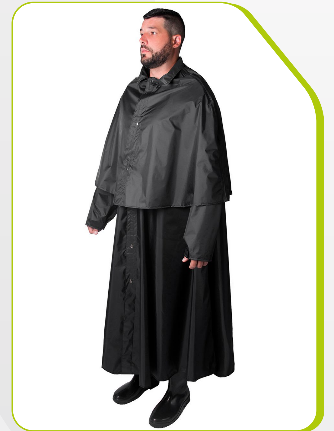
CAPA TIPO "MONTARIA" IMPERMEÁVEL