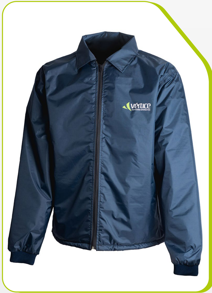
JAPONA ADMINISTRATIVA IMPERMEÁVEL