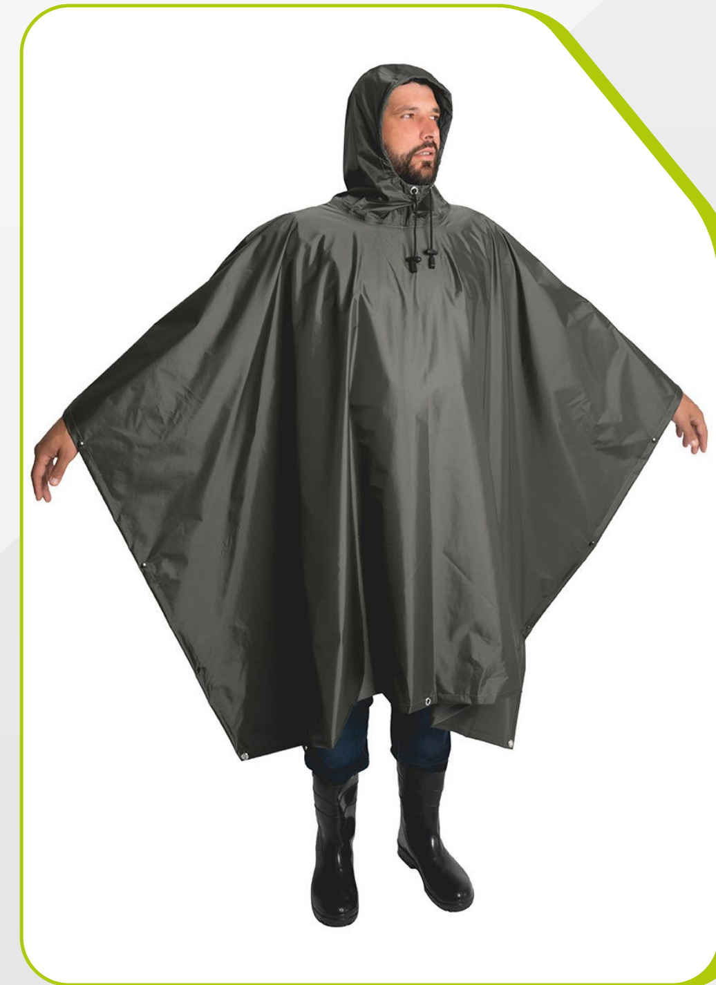
CAPA TIPO "PONCHO" IMPERMEÁVEL